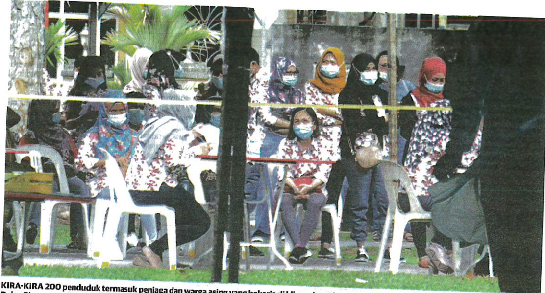
KIRA-KIRA 200 penduduk termasuk peniaga dan warga asing yang bekerja di kilang dan tinggal di asrama di sekitar Taman Poket, Batu Maung, Pulau Pinang menjalani saringan Covid-19, semalam.