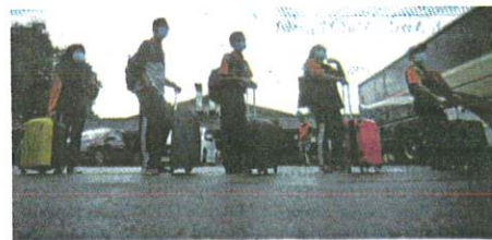
PELAJAR Sekolah Menengah Sains Labuan (SMSL) beratur untuk menaik bas ke Lapangan Terbang Labuan dalam proses penghantaran balik melalui pengangkutan udara ke Kota Kinabalu, Sabah, semalam.

"Setakat jam 12 tengah hari (semalam) enam kematian dilaporkan menjadikan jumlah kumulatif kes kematian 300 kes," katanya.