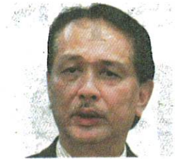
Dr Noor Hisham Abdullah

"Walaupun kesannya belum diketahui, kita bimbang jika mutasi